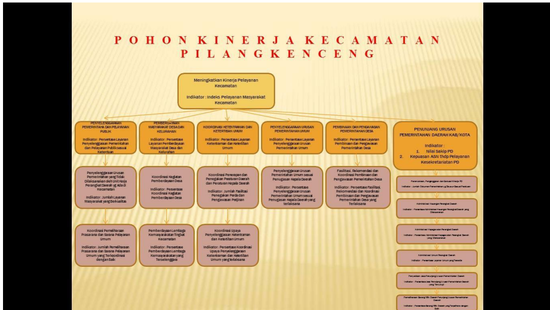
Gambar 4.1 Logical Framework Kecamatan Pilangkenceng Kabupaten Madiun