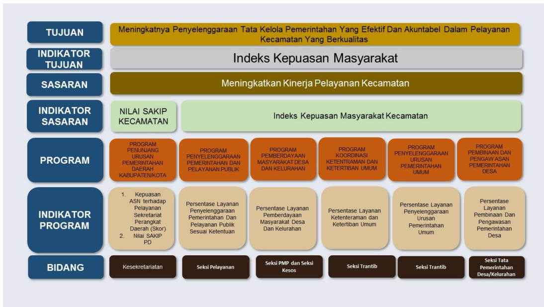
Gambar 4.2 Cascading Kecamatan Pilangkenceng Kabupaten Madiun